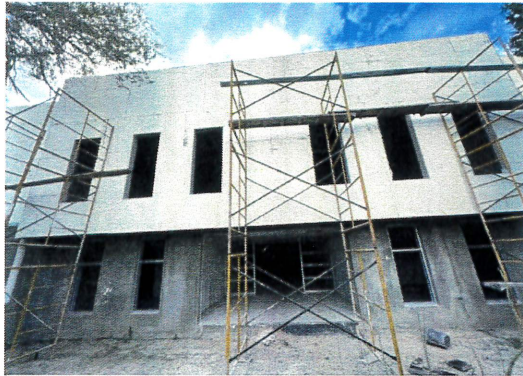
F1: Fachada principal