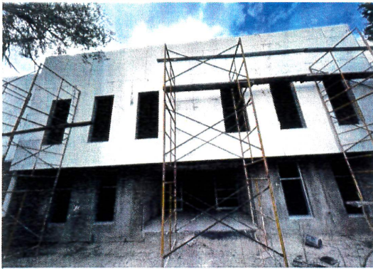
F1: Fachada principal