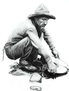
Figura 1. Las cribas se utilizan en la búsqueda de oro

Reconocer alguna característica de interés en un conjunto en el que se presentan muchas otras características es lo que en español denominamos cribado, tamizado o escrutinio; de hecho, el término criba (del latín, cribrum) hace referencia a una lámina agujereada y fija en un arco de madera donde se pueden seleccionar los objetos que pueden pasar a través de dichos agujeros, como la usada por los mineros en la búsqueda de pepitas de oro (Figura 1). El término anglosajón para describir lo anterior es screening (2).